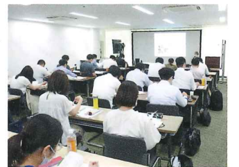
セミナー受講風景