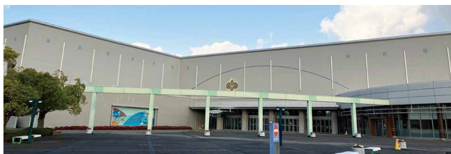
晴天!会場のサンメッセ香川。

2023年11月28日(火)・29日(水)に、香川県高松市のサンメッセ香川にて「リックフェスティバル四国」を開催いたしました。多分野にわたる建築・内装製品を一堂に展示＆即売!という事で、再開を待ちわびていた300社にも及び四国全域の内装工事店様、インテリア専門店様にご来場いただきました。お忙しい中、ご来場いただいた皆様、誠にありがとうございました!会場では、40社ものメーカーにお集まりいただき、インテリア・内装材から建材、建築金物、副資材、工具、家具などあらゆる内装資材をご覧いただきました。特に、地方都市では新製品や専門的な製品を実際に見て触れる機会が限られる事も多いため、来場者の皆様にはご満足いただけたはず!と自負しております。