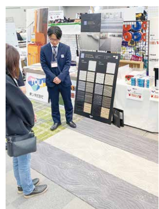
ソコイタリ サウンドスケア

今回、新発売の「ソコイタリ サウンドスケア」を初めてご覧になれる方も多くみえました。「ソコイタリ サウンドスケア」は日経BP社が発行する建築の総合情報誌「日経アーキテクチャ」2023年11月23日号「採用したい建材・設備メーカーランキング2023」のタイルカーペット部門にて、第1位に選出された注目の製品です。カーペットの端材で製作した玄関マットをドッサリ購入されるお客様もみえました。ありがとうございました!!