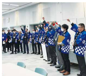
開場前に気合をいれます。