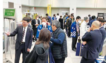
ご覧の通り大盛況!!