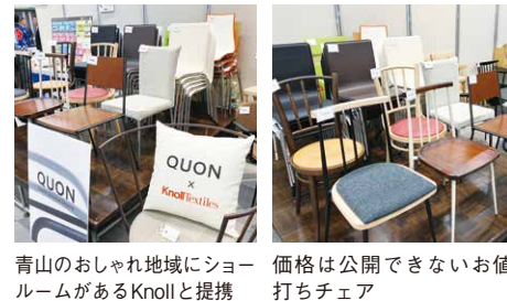
青山のおしゃれ地域にショールームがあるKnollと提携。価格は公開できないお値打ちチェア。

オーツ様のブランド「QUON」のブースです。東京は青山のおしゃれエリアにショールームがあるKnollと提携して椅子張生地を展開しています。今回は、2日間限定の特別価格でご提供いたしました。お値打ちすぎて、会場での価格は公開できません。