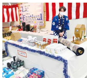
恒例のくじ引きコーナー。