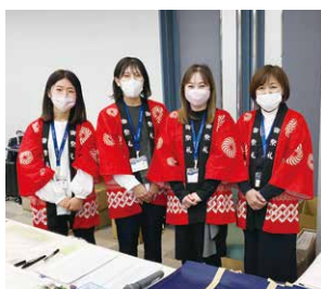
受付準備もバッチリ。