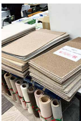
カーペットの端材で製作した玄関マットを即売。