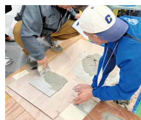
来場者様には実際にパテを体験していただきました。