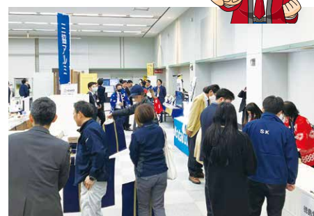
ご覧の通り大盛況!!